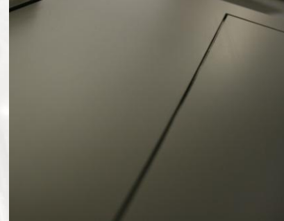
Gereinigd en gehard RVS

Roestvast staal vereist een vakkundige behandeling. TPU Services is zeer vertrouwd met de vakkundige behandeling van roestvast staal. Met name voor de voedingsmiddelen- en chemische industrie leveren wij hoogstaand specialistisch werk. Vooral in deze voedingsmiddelenindustrie stelt men de hoogste eisen en strengste normen aan de oppervlakte ruwheid en de corrosiebestendigheid van het roestvast staal.